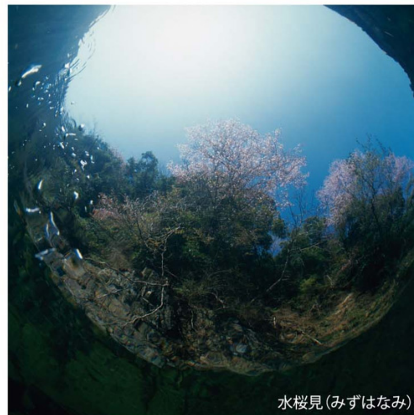
水桜見(みずはなみ)