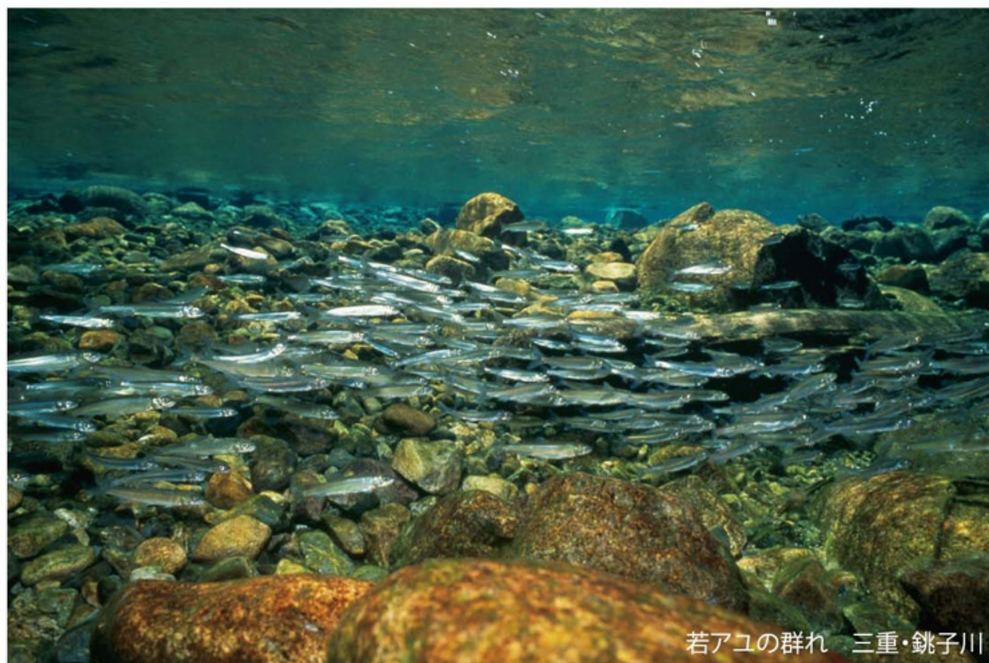
若アユの群れ 三重・銚子川