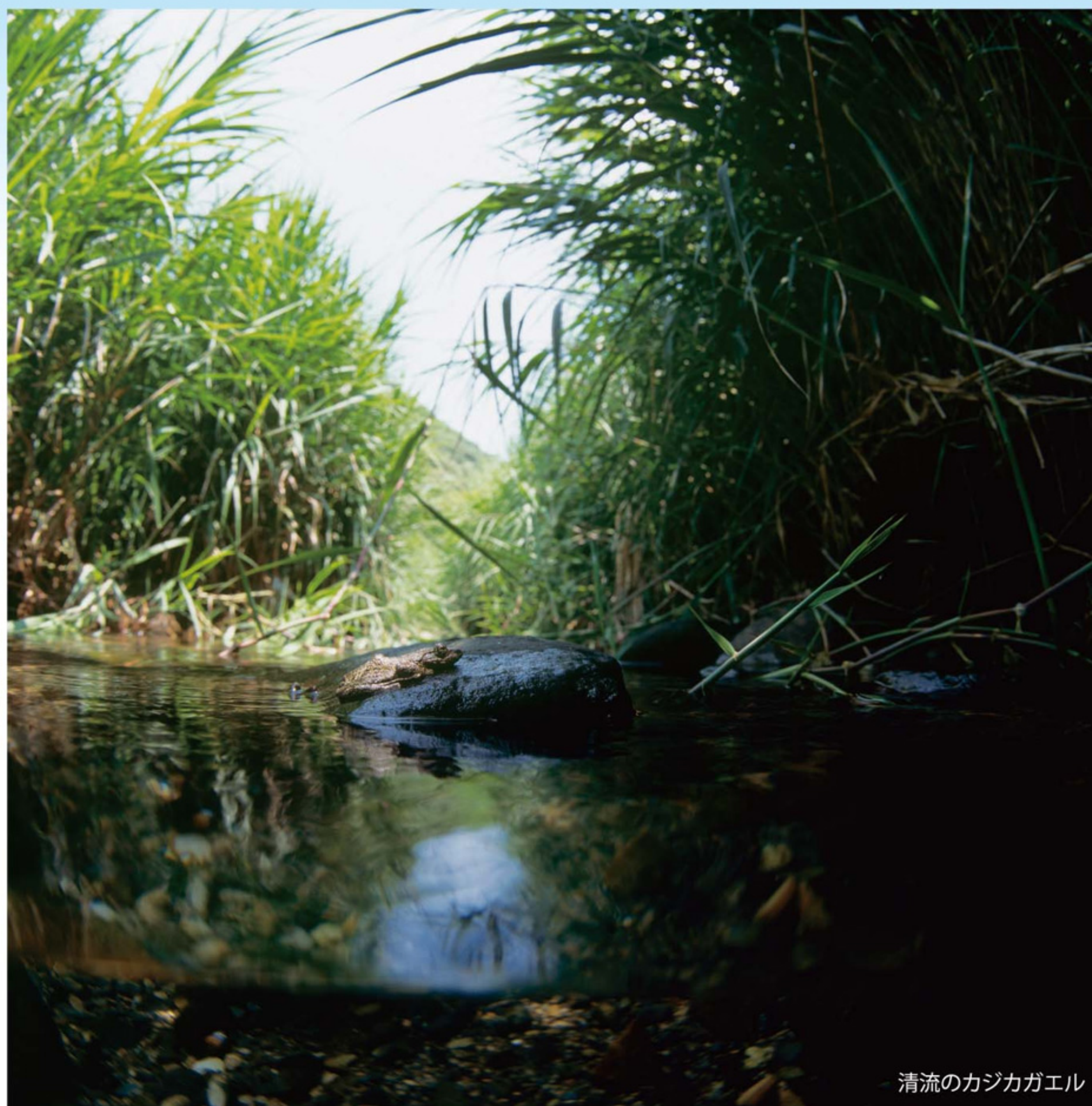
清流のカジカガエル

この写真展は、水に棲む多様ないきものたちを中心にしながら、あえて「水」そのものの作品も出展している。豊かで清らかな水のもたらす多くの恵みや水環境に思いを馳せる時間を過ごしていただけたらと思う。